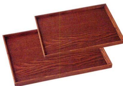
T81 33 004 ボックストレイ 36cm BR [CN] L-36 S-27 H-2.6 ¥4,200