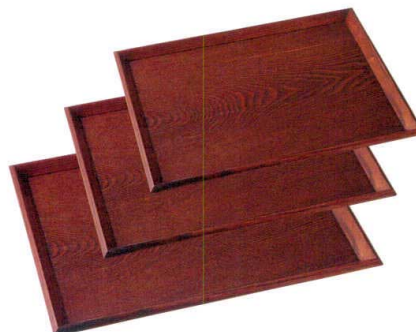
T81 33 015 フラットトレイ 36cm BR [CN] L-35.8 S-27.7 H-2.6 ¥4,100