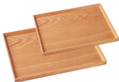
T81 32 004 ボックストレイ 36cm NR [CN] L-36 S-27 H-2.6 ¥4,200