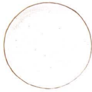
515 22 008 石目 7.0皿 D-22.5 H-3.1 ¥1,400