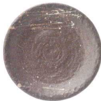
515 32 008 石目 7.0皿 D-22.5 H-3.1 ¥1,400