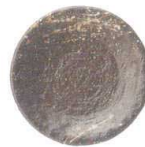
515 32 012 石目 5.0皿 D-16.3 H-2.3 ¥700