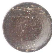
515 32 010 石目 6.0皿 D-19.5 H-2.8 ¥900