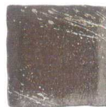
516 32 063 石目 6.0正角皿 D-17.2 H-3.3 ¥1,400