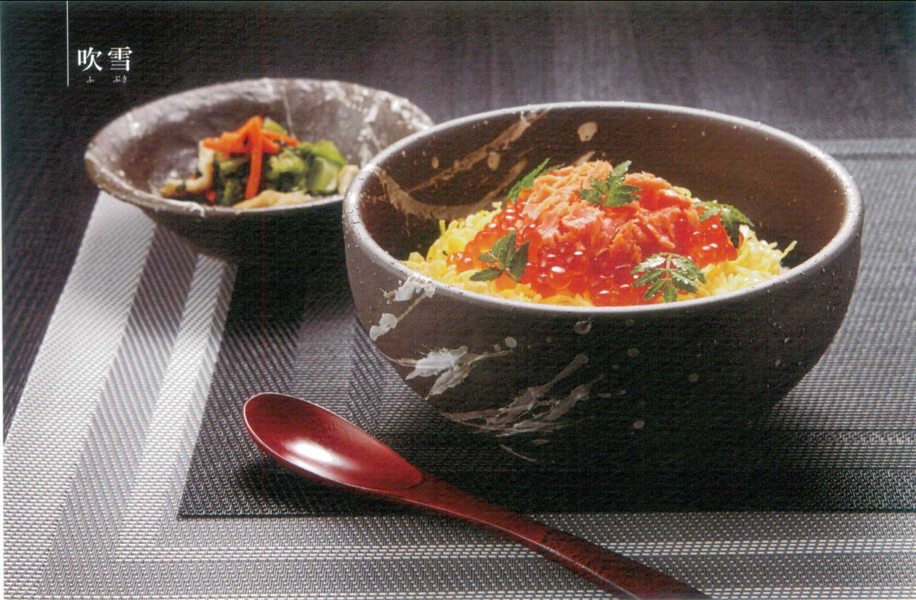
■吹雪 石目 4.0鉢 ■吹雪 石目 5.0丼