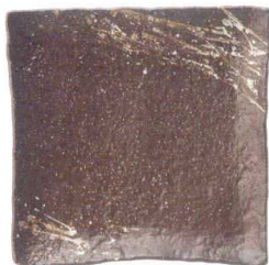
516 32 060 石目 9.0正角皿 D-27.6 H-4.5 ¥4,000