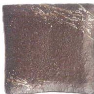
516 32 062 石目 7.0正角皿 D-21.7 H-3.7 ¥2,200