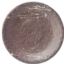
515 32 006 石目 8.0皿 D-25 H-3.2 ¥2,100