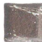
516 32 065 石目 5.0正角皿 D-14.6 H-2.9 ¥1,200