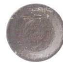
515 32 014 石目 4.5皿 D-14 H-2 ¥600