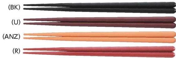
TH-220S はし 220mm ¥340 ※TH-220Sは表面模様が「木目」です。