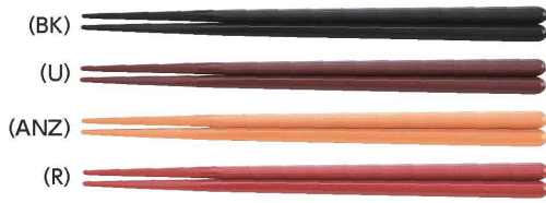
TH-195S はし 195mm ¥320