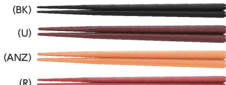
TH-180S はし 180mm ¥300