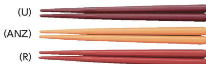
新 TH-160S はし 160mm ¥290