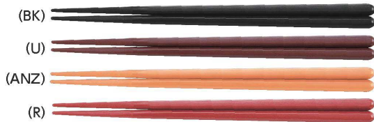
TH-210SN はし 210mm ¥330