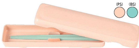
BX-1 はし箱(仕切りあり) 225×57×25 ¥570