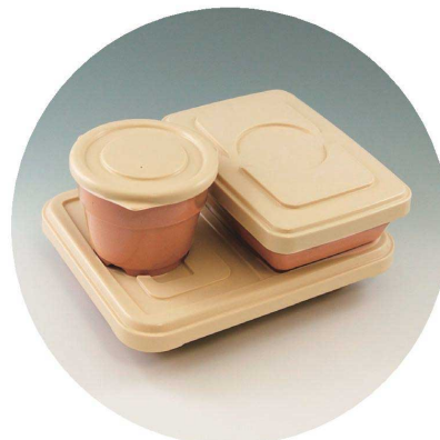
P-5 R 弁当箱舟型(小) 168×120×42・400ml 身 ¥360 / 蓋 ¥340 セット/¥700

●市町村・給食センターなどの特別注文に対応しています。形状・価格・ロットにつきましては、最寄りの営業所にお問い合わせください。