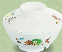
MB-101 GF 幼児飯椀蓋 105×31 ¥660