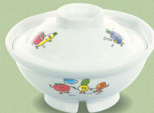
MB-105 GF 小児飯丼蓋 117×34 ¥700