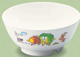
MB-3 GF 小児飯碗 120×54・330ml ¥1,080