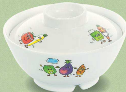
MB-102 GF 汁椀蓋 102×25 ¥540