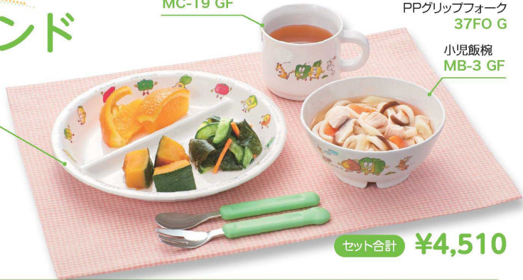
小児飯碗 MB-3 GF