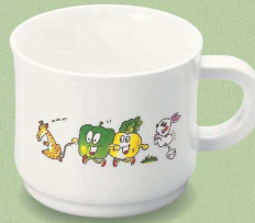
MC-19 GF マグカップ 97×74×62・180ml ¥1,100