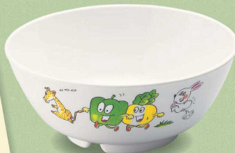
MB-8 GF うどん丼 145×60・570ml ¥1,310