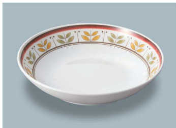
MS-248 CRM(カルメラ) 深皿 AB 198 × 43 ・ 780ml ¥1,810 C-200 ¥550 → P.282