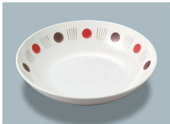
MS-248 KNA(奏) 深皿 AB 198 × 43 ・ 780ml ¥1,810 C-200 ¥550 → P.282