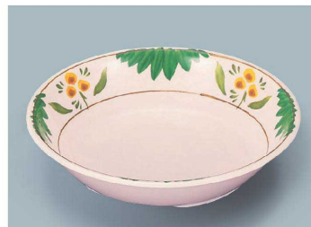
MS-2120 DL(デル・レッタ) カレー皿 198 × 43 ・ 720ml ¥1,590 C-200 ¥550 → P.282