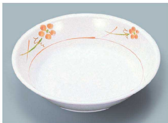
MS-2120 YUK(友花) カレー皿 198 × 43 ・ 720ml ¥1,580 C-200 ¥550 → P.282