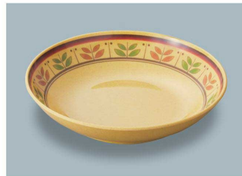
MS-248 CMM(カルメラマスタード) 深皿 AB 198 × 43 ・ 780ml ¥1,860 C-200 ¥550 → P.282