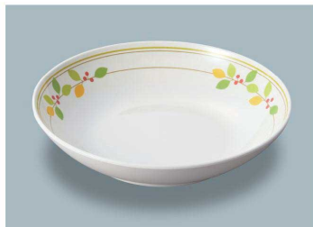
MS-248 NNA(ニーナ) 深皿 AB 198 × 43 ・ 780ml ¥1,810 C-200 ¥550 → P.282