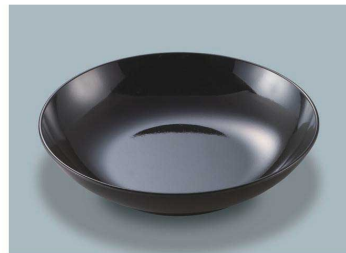
MS-248 KMT(黒マット) 深皿 AB 198 × 43 ・ 780ml ¥1,620 C-200 ¥550 → P.282