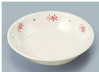
MS-2120 HKK(花ころも) カレー皿 198 × 43 ・ 720ml ¥1,590 C-200 ¥550 → P.282