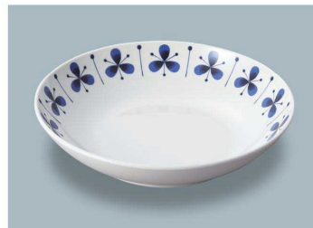
MS-248 PIT(ピアット) 深皿 AB 198 × 43 ・ 780ml ¥1,810 C-200 ¥550 → P.282