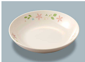
MS-248 HMT(花小町) 深皿 AB 198 × 43 ・ 780ml ¥1,810 C-200 ¥550 → P.282