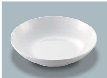
MS-248 W(ホワイト) 深皿 AB 198 × 43 ・ 780ml ¥1,620 C-200 ¥550 → P.282