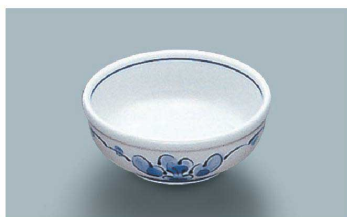
KB-840 SEI(青風)丸千代口 81 × 33 ・ 90ml(10/120) ¥1,160 ☉ P-204 ¥390 → P.284