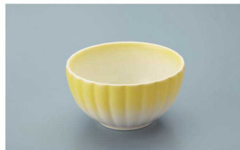
KB-799 YH(黄吹)菊型小付 75 × 40 ・ 100ml(10/120) ¥1,530 ☉ P-204 ¥390 → P.284