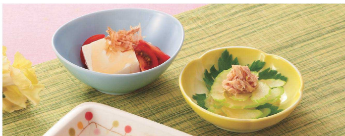
使用食器 | Z-4 UU 角皿、KB-797 LG 楕円小鉢、KB-750 YH 華小鉢