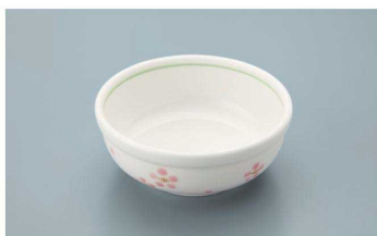
KB-840 RIO(里桜)丸千代口 81 × 33 ・ 90ml(10/120) ¥1,160 ☉ P-204 ¥390 → P.284