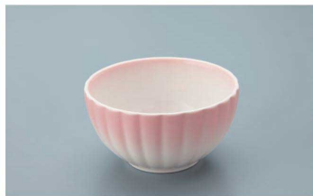
KB-799 PH(ピンク吹)菊型小付 75 × 40 ・ 100ml(10/120) ¥1,530 ☉ P-204 ¥390 → P.284