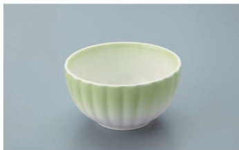
KB-799 GH(緑吹)菊型小付 75 × 40 ・ 100ml(10/120) ¥1,530 ☉ P-204 ¥390 → P.284