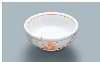
KB-840 HH(初花)丸千代口 81 × 33 ・ 90ml(10/120) ¥1,160 ☉ P-204 ¥390 → P.284