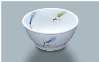
KB-831 AZ(あじわい)小鉢 86 × 41 ・ 110ml(20/240) ¥1,450 ☉ P-204 ¥390 → P.284