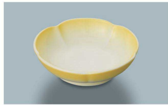
KB-750 YH(黄吹)華小鉢 100 × 29 ・ 100ml(10/100) ¥1,600 ☉ C-113 ¥380 → P.284