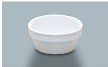
YB-256 SRI(白)ココット 79 × 37 ・ 110ml(10/240) ¥1,020 ☉ P-204 ¥390 → P.284