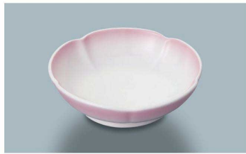
KB-750 PH(ピンク吹)華小鉢 100 × 29 ・ 100ml(10/100) ¥1,600 ☉ C-113 ¥380 → P.284