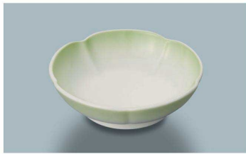
KB-750 GH(緑吹)華小鉢 100 × 29 ・ 100ml(10/100) ¥1,600 ☉ C-113 ¥380 → P.284