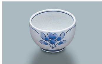
KB-412 SEI(青風)小付 70 × 45 ・ 100ml(10/100) ¥1,410 ☉ C-70 ¥270 → P.284