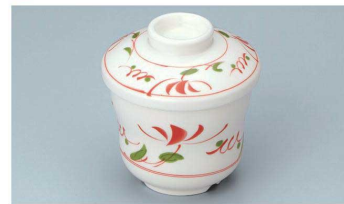
YB-141 AE(赤絵) 茶碗蒸し蓋