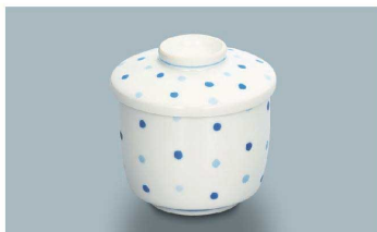
KF-888 MZB(水玉青) 茶碗蒸し蓋