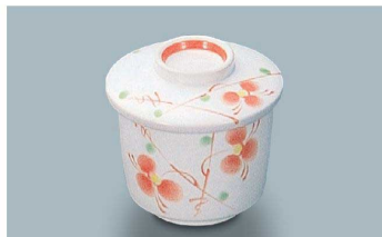
KF-871 HH(初花) 茶碗蒸し蓋