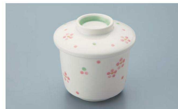
KF-871 RIO(里桜) 茶碗蒸し蓋