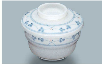
YB-142 HG(萩) 広口蒸碗蓋