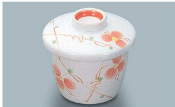
KF-824 HH(初花) 茶碗蒸し蓋