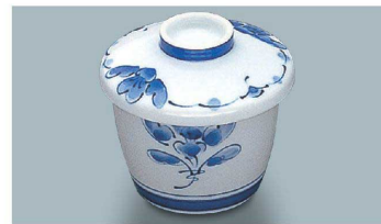
KF-824 SEI(青風) 茶碗蒸し蓋