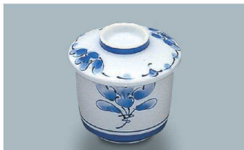
KF-871 SEI(青風) 茶碗蒸し蓋