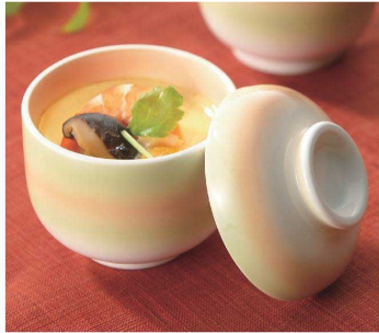
使用食器 | YF-277 GOH・YB-276 GOH むし碗