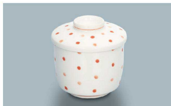
KF-888 MZR(水玉赤) 茶碗蒸し蓋