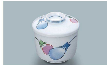
KF-888 AZ(あじわい) 茶碗蒸し蓋