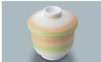
YF-279 GOH(緑オレンジ吹) 茶碗蒸し蓋