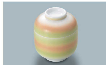
YF-277 GOH(緑オレンジ吹) むし碗蓋