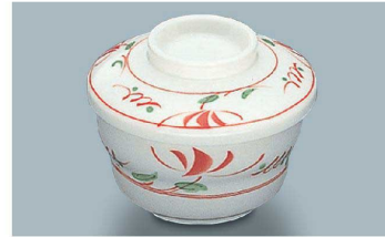
YB-142 AE(赤絵) 広口蒸碗蓋