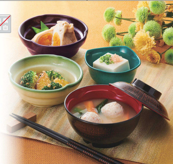
使用食器 | QF-2 AKE・QB-2S AKE 汁椀、T-503 SNR 小鉢、T-503 AME 小鉢、T-504 KJA 小鉢、TH-220X KUS PBT塗り箸