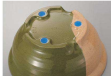
使用食器 | UMS-430 ORN 精円皿、UMF-403 TUS・UMB-402 TUS 安定型汁椀、AH-220S AA アミハード箸