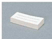
PHK-F101 ファミリーズ名札 ¥1,500 (50枚セット)