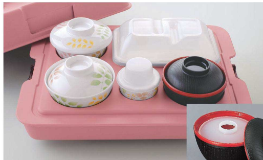
PHK-401 PUP 398 × 308 × 156 ¥9,310 ※食器は別売りです。