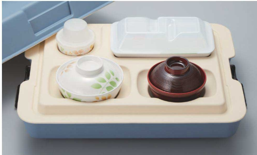
PHK-401N B 398 × 308 × 156 ¥9,310