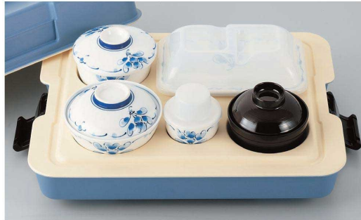
PHK-401 B 398 × 308 × 156 ¥9,310