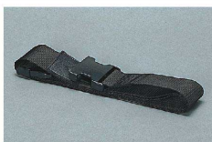
PHK-B1 ファミリーズバンド