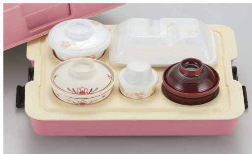
PHK-401 P 398 × 308 × 156 ¥9,310