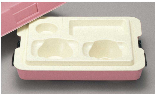
PHK-401N P 398 × 308 × 156 ¥9,310