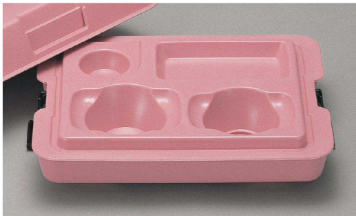
PHK-401N PUP 398 × 308 × 156 ¥9,310