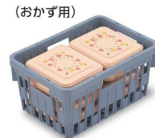
PSK-200の使用例 Lb ランチボックス おかず用×8セット ※PSK-170の場合：8セット収納 ※ばんじゅうの場合：12セット収納