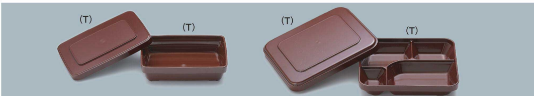
U-252E T ご飯用(蓋)