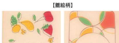
●ベジらんど (VEG) ●しゃぼん玉 (SYA)