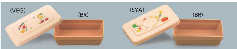
P-252E VEG・SYA ご飯用(蓋) 163×114×16 ¥1,390