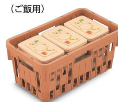
PSK-170の使用例 Lb ランチボックス ご飯用×12セット ※ばんじゅうの場合：20セット収納