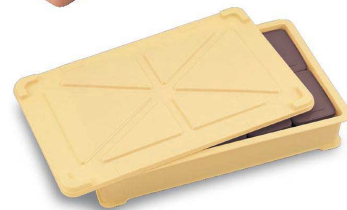
ばんじゅう参考サイズ(外寸) (蓋)654×406×24 (身)644×393×113