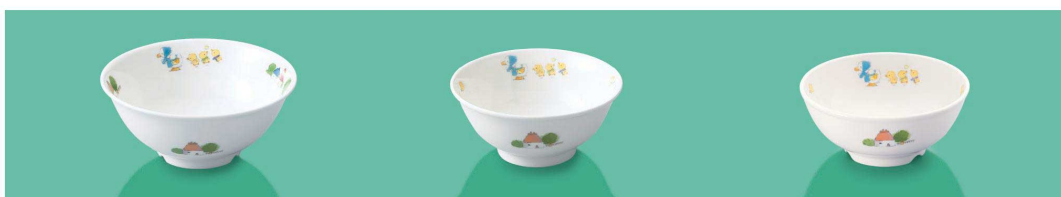
YB-5 FU 飯碗 141 × 60 ・ 440ml (5/80) ¥1,610 C-140 ¥410 → P.283