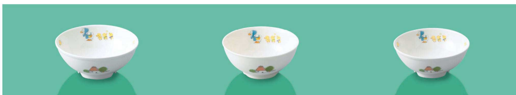
YB-2 FU 幼児碗 117 × 47 ・ 250ml (5/100) ¥1,410