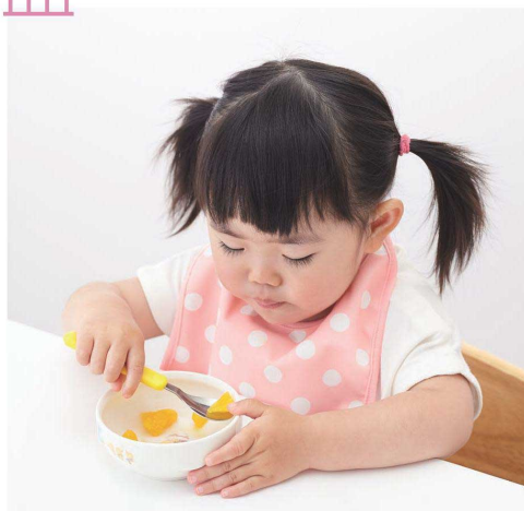
使用食器 | YB-73 FU 深皿、18SP Y PPグリップスプーン

深皿(YS-39)は、こぼしにくい深さと、側面が立っているため、食材がすくいやすい形です。