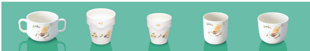
YC-10 FU 両手マグカップ 122 × 82 × 58 ・ 200ml (6/60) ¥1,760