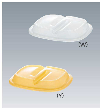
C-21 186 × 156 × 26 ¥510 (適応食器 PNS-21E)