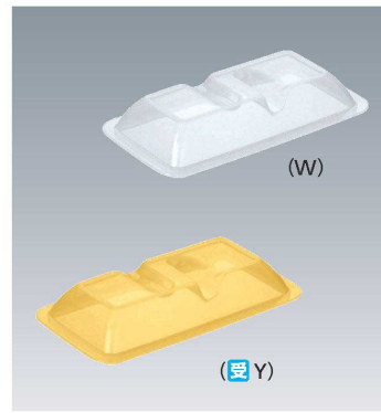
C-1911 194 × 107 × 35 ¥530 (適応食器 MS-553)