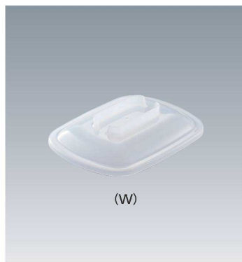
C-1713 174 × 134 × 34 ¥530 (適応食器 MS-282)