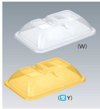
C-1913 203 × 133 × 46 ¥530 (適応食器 KS-433 / MS-555 / MS-558)