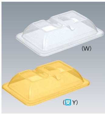
C-2013 208 × 139 × 45 ¥550 (適応食器 KS-864 / YS-31)