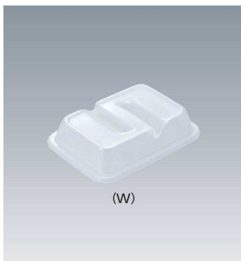
C-1712 177 × 127 × 37 ¥530 (適応食器 MS-956)