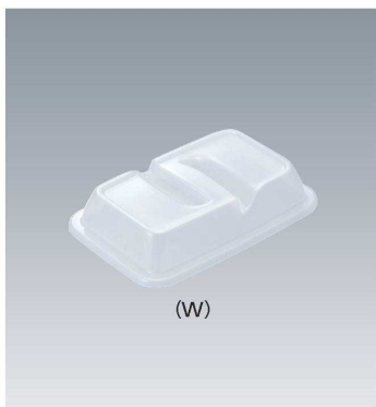
C-1912 193 × 126 × 37 ¥530 (適応食器 MS-958)