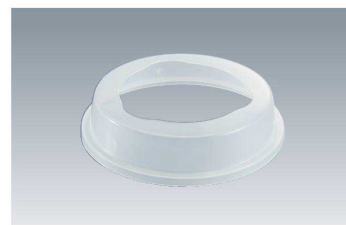
W-210 W 21cm用皿枠 219 × 49 ¥440 (適応食器 MS-842)