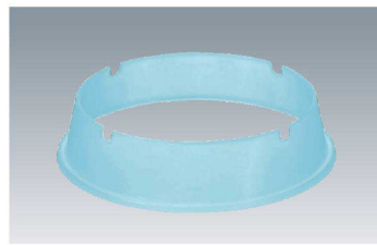
195-OP B 23cm用皿枠 237 × 55 ¥330 (適応食器 MS-528 / MS-541 / MS-569)