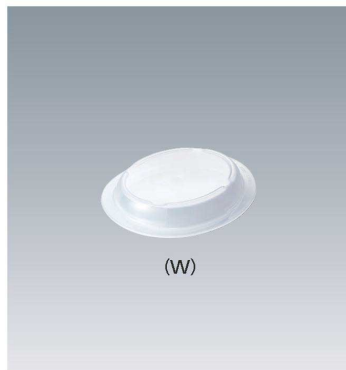
C-1109 121 × 104 × 24 ¥440 (適応食器 MB-630)