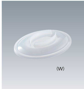
C-1914 190 × 144 × 31 ¥530 (適応食器 MS-210)