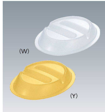
P-209 174 × 126 × 31 ¥530 (適応食器 MS-460 / MS-560 / YS-64)