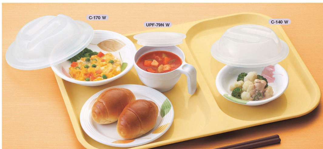
使用食器 | MS-526 HNE パン皿、C-170 W フードカバー、MS-565 HNE クラブ皿、UPF-79N W スープカップ蓋、MC-80 SW スープカップ、C-140 W フードカバー、MS-533 HNE ベリー皿、AH-220S AA アミハード箸 ※トレイは参考商品です。