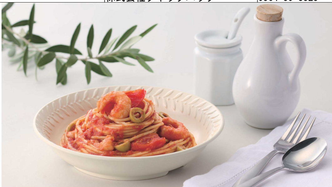
使用食器 | U-578 IV クープ皿、TAS-02 デザートフォーク、TAS-01 デザートスプーン