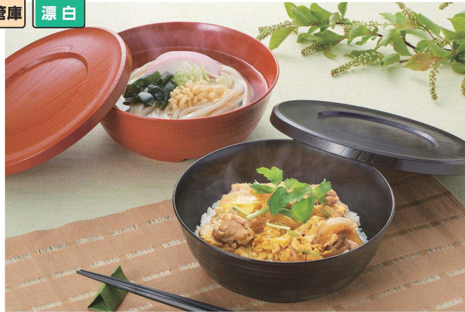
使用食器 | U-97 SYU・U-96 SYU 丼、U-97 KTI・U-96 KTI 丼、TH-220S KTS PBT塗り箸