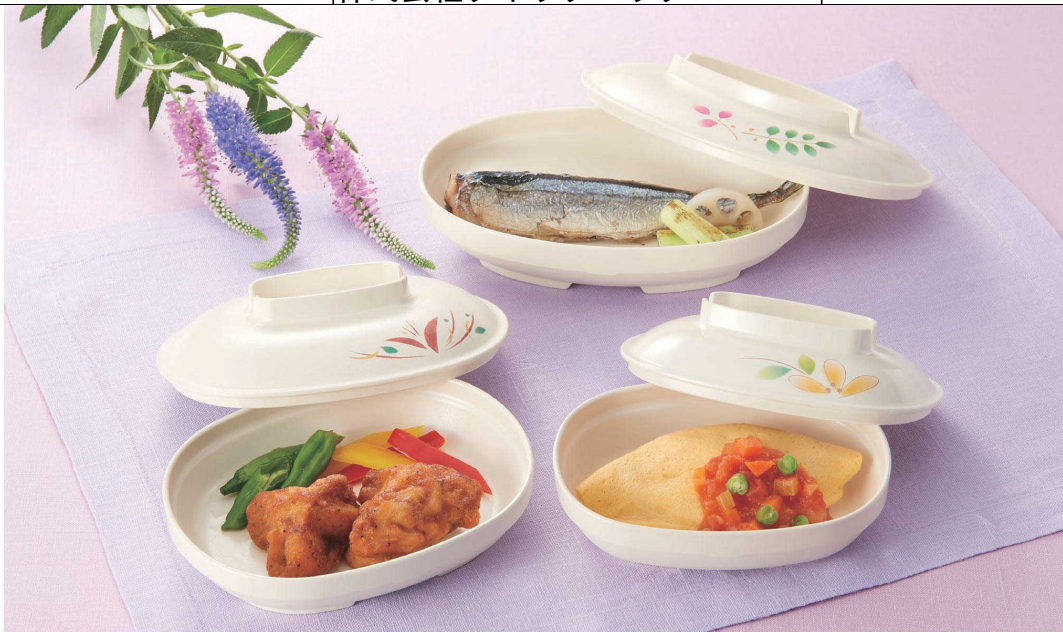
使用食器 | U-151W HNE・U-150 IV 楕円皿、U-149W AE・U-148 IV 楕円皿、U-147W HRK・U-146 IV 楕円皿