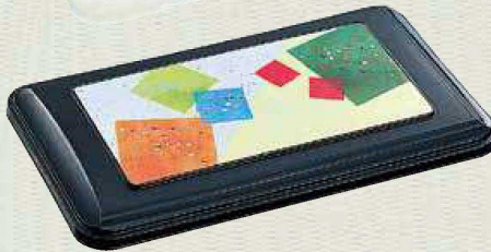
蓋:SFI-2000 カラー：クロ 柄：折紙