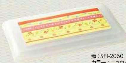
蓋:SFI-2060 カラー：ニューハク 柄：ブーケ