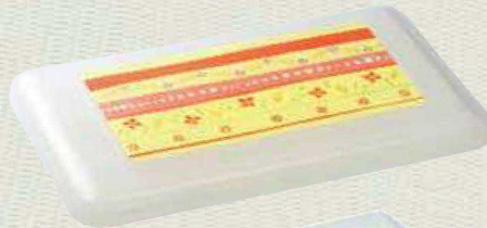
蓋:SFI-2000 カラー：ニューハク 柄：ブーケ