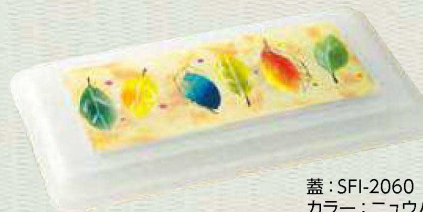
蓋:SFI-2060 カラー：ニューハク 柄：リーフ