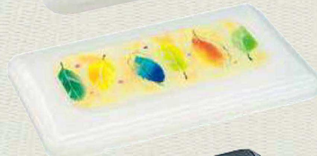
蓋:SFI-2000 カラー：ニューハク 柄：リーフ