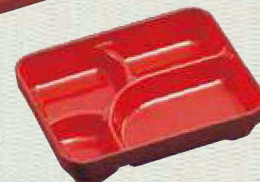
カラー：ワインパール (朱)