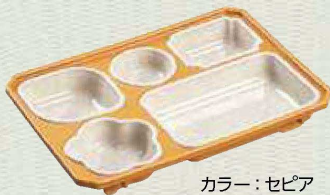
カラー：セピア (ベージュ石目)