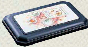
蓋：WFT-1900 カラー：Kコン 柄：ハッピーテーブル