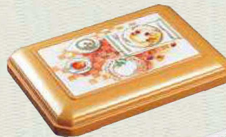
蓋：WFT-1800 カラー：セピア 柄：ハッピーテーブル