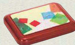
蓋：No.147 カラー：ワインパール 柄：折紙