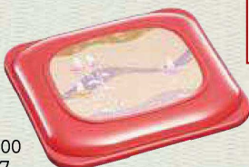
蓋：WFT-1300 カラー：ピンク 柄：ゆりのうた