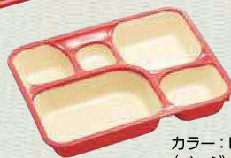
カラー：ピンク (ベージュ)