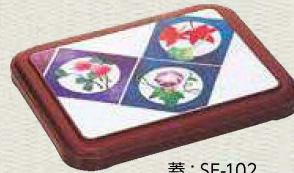
蓋：SF-102 カラー：ワインレッド 柄：押花