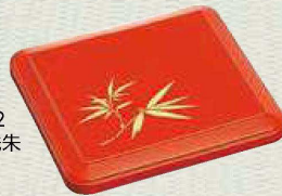
蓋：No.32 カラー：洗朱 柄：笹

パール副食容器 190×168×49H 1,000円 コンテナ入数:No.10-1(12) No.90(12)