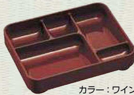
カラー：ワインレッド

あけぼの副食容器 205×164×50H 1,120円 コンテナ入数:No.90(12)