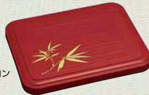
蓋：No.40 カラー：マロン 柄：笹

お好み副食容器 219×169×50H 1,200円 コンテナ入数:No.10-1(10) No.90(10)