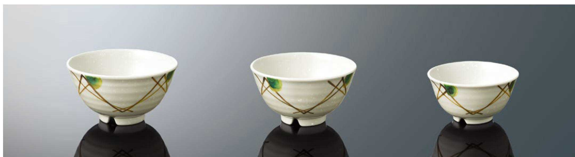
A72MKZ 丸茶碗 大 TAB 137×73(550ml) ¥1,200 ●PP013 ¥300(P254) 組高90