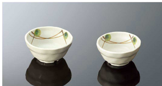
G19MKZ 丸深小鉢 TAB 103×49(210ml) ¥950 ●PP010 ¥260(P254) 組高63