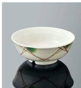
B35MKZ 羽反煮物碗 TAB 137×53(380ml) ¥1,160 ●PP013 ¥300(P254) 組高70