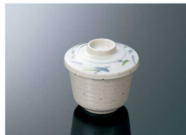
B10SA むし碗 組高87 [IAB] 身 B 87×68 (240ml) ¥590 蓋 C 94×25 ¥480 ●PP008 ¥230 (P253) 組高84 ※B10Bは内側グレースコーティング製品です。