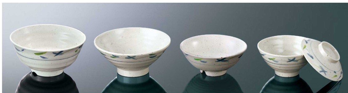
A25SA 井大 157×76 (720ml) ¥1,230 ●PP116 ¥430 (P254) 組高89