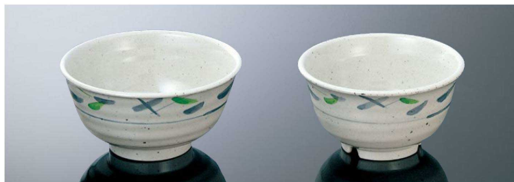
A28SA 大井 [IAB] 169×84 (1.0L) ¥1,720 ●PP117 ¥440 (P254) 組高97 ※IWのみ