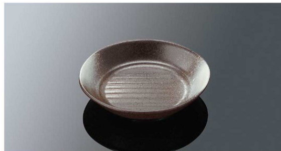
T0509 16.5cm丸深皿 鉄泉 TAB 165×35(390ml) ¥2,730 PP016 ¥440 (P255) 組高71