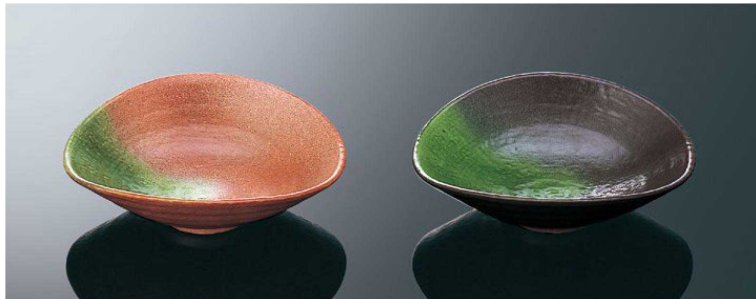
T4105 6寸向付 若草 178×160×58(350ml) ¥4,480