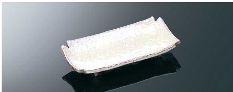
T1206 7寸隅切長手焼物皿 粉引 TAB 217×110×35 ¥5,030