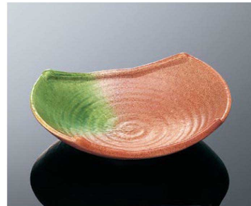
T4005 6寸巻刺身鉢 若草 TAB 陶 180×145×48 ¥4,480