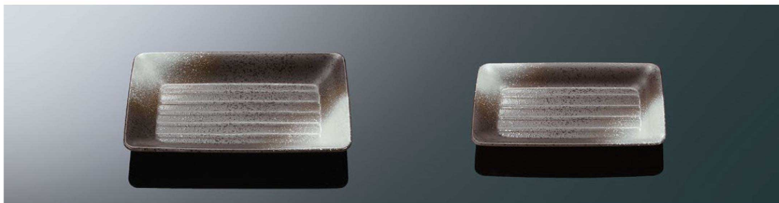
T1109 長角皿 大 鉄泉 TAB 201×128×26 ¥2,980 PP120 ¥480 (P257) 組高63