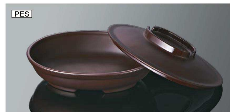
DS8BBN 小判深皿 大身 ブラウン 組高66 TAB 168×128×40(415ml) ¥1,970 PES DS8CBN 小判深皿 大蓋 ブラウン 170×130×31 ¥1,740 PES