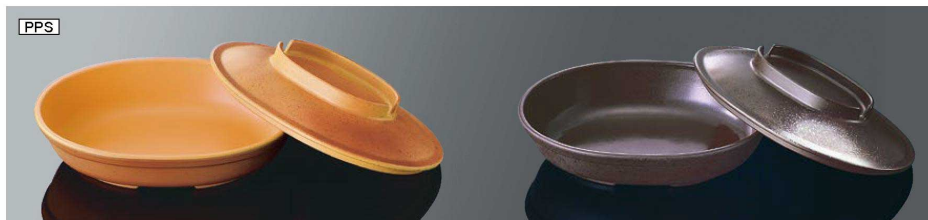
DS2Yo 小判深皿 大 イエローオレンジ 組高65 身 B 168×128×39(400ml) ¥2,870 PPS 蓋 C 170×130×32 ¥2,220 PPS