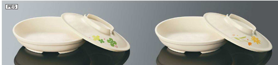
DS8B 小判深皿 大身 乳白 組高66 TAB 168×128×40(415ml) ¥1,970 PES DS8Ccv 小判深皿 大蓋 クローバー 170×130×31 ¥1,950 PES