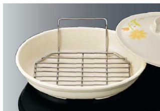
T-103 羽付八角スノコ 新製品 124×112×36 ¥2,300 18-8 ステンレス ※ DS8・D181 に対応