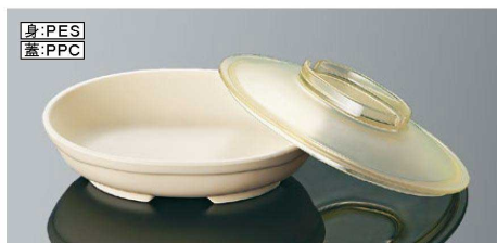
DS8B 小判深皿 大身 乳白 組高66 TAB 168×128×40(415ml) ¥1,970 PES DS8CAMB 小判深皿 大蓋 アンバー 170×130×31 ¥1,070 PPC