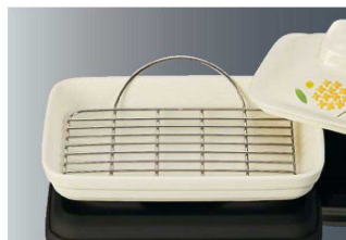
T-104 羽付角スノコ 140×116×29 ¥1,860 18-8 ステンレス ※ DS11BI・DS11BBN・S81 に対応