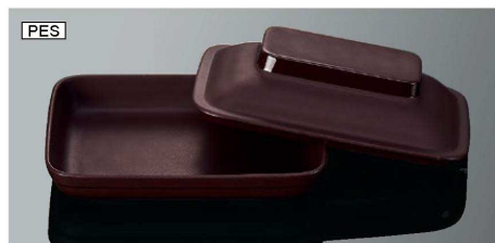
DS11BBN 角皿 身 ブラウン 組高61 TAB 新製品 168×124×27 (370ml) ¥2,170 PES DS11CBN 角皿 蓋 ブラウン 新製品 170×126×39 ¥2,030 PES