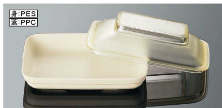
DS11BI 角皿 身 乳白 組高61 TAB 新製品 168×124×27 (370ml) ¥2,170 PES DS11CAMB 角皿 蓋 アンバー 新製品 170×126×39 ¥1,170 PES