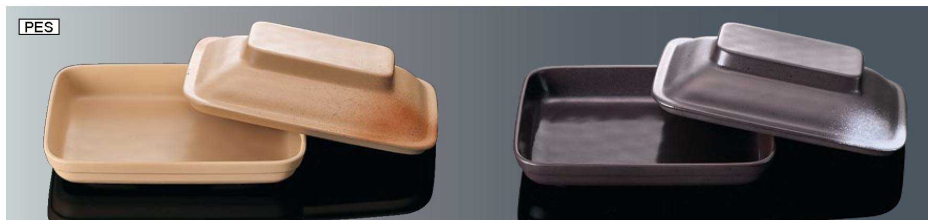
DS11BHDS 角皿 身 火だすき 組高61 TAB 新製品 168×124×27 (370ml) ¥3,660 PES DS11CHDS 角皿 蓋 火だすき 新製品 170×126×39 ¥2,920 PES