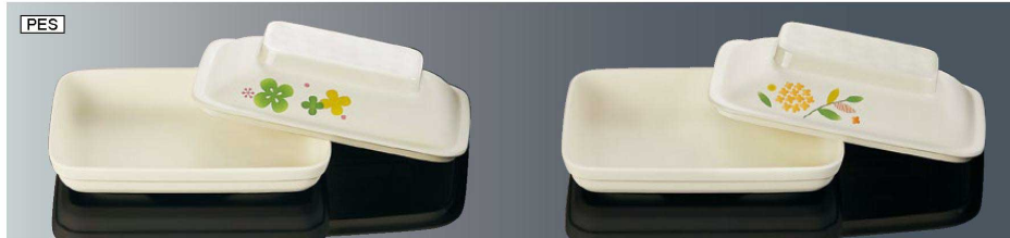
DS11BI 角皿 身 乳白 組高61 TAB 新製品 168×124×27 (370ml) ¥2,170 PES DS11CCV 角皿 蓋 クローバー 新製品 170×126×39 ¥2,380 PES