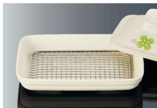
T-102 角スノコ 138×95 ¥1,860 18-8 ステンレス ※ DS11BI・DS11BBN・S81 に対応