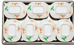
D181 なで角深皿の収納数 ホテルパン：7個