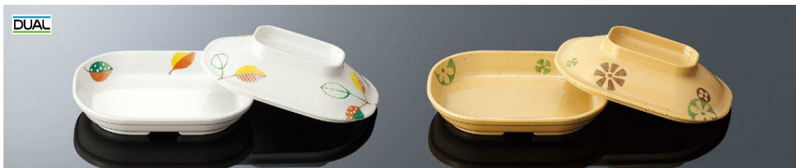
D183IHB なで角深皿 小 色葉ベージュDC 組高58 TAB 優 身B 130×97×31(210ml) ¥1,600 MF 蓋C 132×99×32 ¥1,480 MF