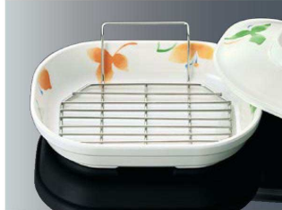
T-103 羽付八角スノコ 新製品 124×112×36 ¥2,300 18-8 ステンレス ※DS8・D181 に対応