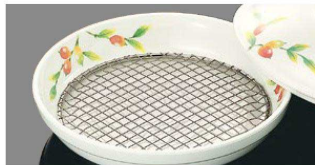
T-101 丸スノコ 124 ¥1,970 18-8ステンレス ※DS5B1・DS5BBN・DS6・D177・S73 に対応

18-8ステンレス製ですので、サビることもなく衛生的。加熱時に油分が高温になっても変形の心配がありません。