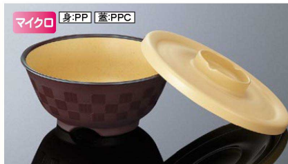
身:PP 蓋:PPC AP146BMTB 市松井 中身 マットブラウン 組高76 140×63(480ml) ¥1,180 PP ※A146TMBの蓋も使えます。 AC146CBE 市松井 中蓋 ベージュ 147×21 ¥900 PPC 白飯: 190g 全粥: 290g