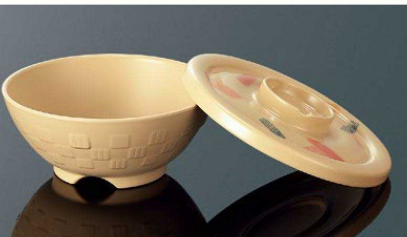
身:PP 蓋:MF AP147BBE 市松井 小身 ベージュ 組高70 133×56(400ml) ¥1,130 PP PP013 ¥300 (P254) 組高73 A147CRIB 井小蓋 リズムベージュ 143×21 ¥1,000 MF 白飯: 160g 全粥: 240g