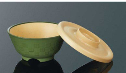
身:PP 蓋:PPC AP148BTMG 市松井 特小身 マットグリーン 組高70 121×58(320ml) ¥1,100 PP PP012 ¥280 (P254) 組高74 AC148CBE 市松井 特小蓋 ベージュ 127×21 ¥740 PPC 白飯: 130g 全粥: 190g