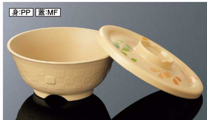
身:PP 蓋:MF AP146BBE 市松井 中身 ベージュ 組高76 140×63(480ml) ¥1,180 PP A146CCVB 井中蓋 クローバー /BE 150×22 ¥1,020 MF 白飯: 190g 全粥: 290g