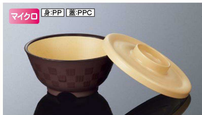
身:PP 蓋:PPC AP148BMTB 市松井 特小身 マットブラウン 組高70 121×58(320ml) ¥1,100 PP ※A148TMBの蓋も使えます。 PP012 ¥280 (P254) 組高74 AC148CBE 市松井 特小蓋 ベージュ 127×21 ¥740 PPC 白飯: 130g 全粥: 190g