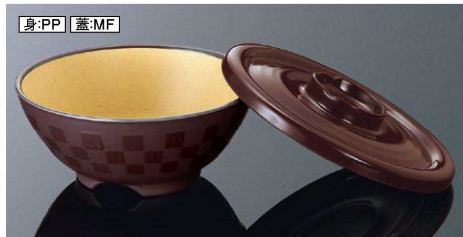
身:PP 蓋:MF AP145BMTB 市松井 大身 マットブラウン 組高77 149×64(580ml) ¥1,290 PP ※A145TMBの蓋も使えます。 A145CGB 井大蓋 ブラウン 159×23 ¥730 MF 白飯: 230g 全粥: 350g