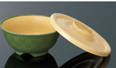
身:PP 蓋:PPC AP146BTMG 市松井 中身 マットグリーン 組高76 140×63(480ml) ¥1,180 PP AC146CBE 市松井 中蓋 ベージュ 147×21 ¥900 PPC 白飯: 190g 全粥: 290g