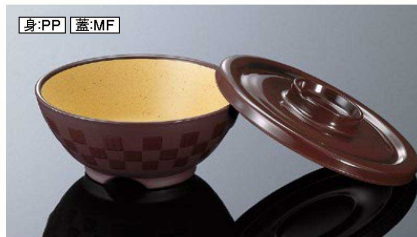
身:PP 蓋:MF AP147BMTB 市松井 小身 マットブラウン 組高70 121×58(400ml) ¥1,130 PP ※A147TMBの蓋も使えます。 PP013 ¥300 (P254) 組高73 A147CGB 井小蓋 ブラウン 143×21 ¥670 MF 白飯: 160g 全粥: 240g