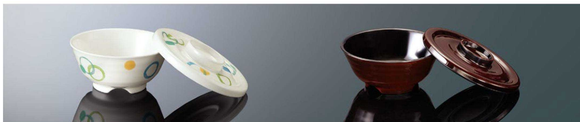
A148LU 丼 特小 ループ 組高69 TAB 身BF 121×56 (320ml) ¥1,140 FMF 蓋CF 130×21 ¥940 FMF PP012 ¥280 (P254) 組高72