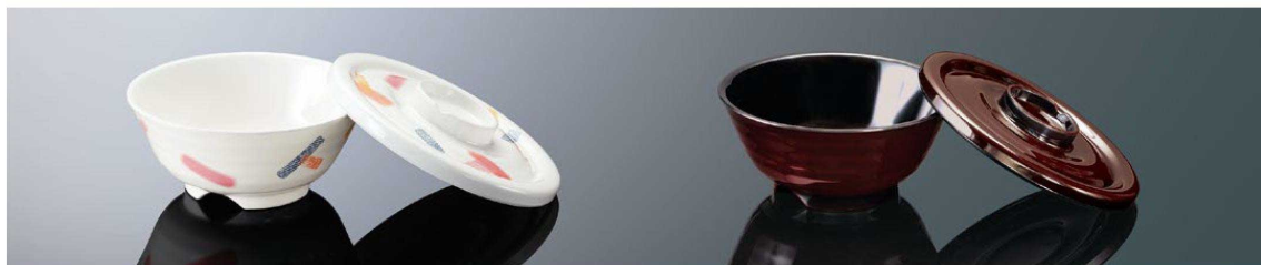
A147RI 丼 小 リズム 組高71 TAB 身BF 132×57 (390ml) ¥1,250 FMF 蓋CF 143×21 ¥1,000 FMF PP013 ¥300 (P254) 組高74