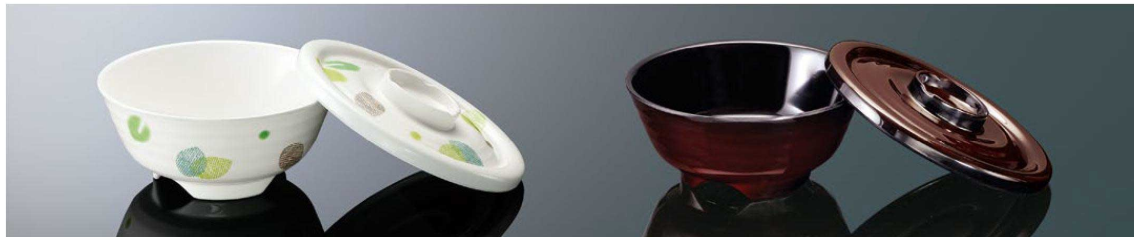
A145HU 丼 大 ハーブ 組高79 TAB 身BF 148×65 (580ml) ¥1,450 FMF 蓋CF 159×23 ¥1,140 FMF