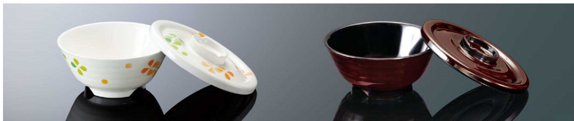
A146CV 丼 中 クローバー 組高77 TAB 身BF 140×63 (485ml) ¥1,320 FMF 蓋CF 150×22 ¥1,020 FMF