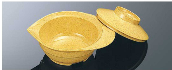
E90SDY ソースポット サンドイエロー 組高77 TAB 身 B 171×136×57 (430ml) ¥940 MF 蓋 C 119×33 ¥500 MF