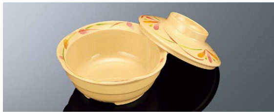
E211HNC 13.5cm ボール 花籠 組高75 TAB 身 B 138×53 (410ml) ¥1,220 MF 蓋 C 119×33 ¥890 MF