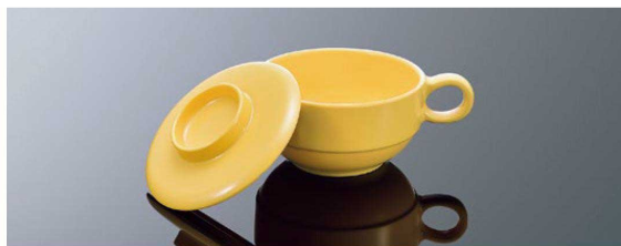
C18Y 柄付スープカップ イエロー 組高73 TAB 身 B 135×106×56 (310ml) ¥1,030 MF 重量(約115g) 蓋 C 108×23 ¥400 MF 重量(約61g)

スープなどの再加熱にびったり。段付きデザインなので、安定してスタッキングでき、収納場所も取りません。