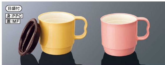
CC11YI マグカップ イエロー/乳白 組高79 106×80×75 (270ml) ¥1,470 PPC 重量(約95g)