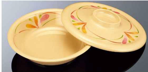
E212HNC 20cm ケープ皿 深型 花籠 組高71 TAB 身 B 199×47 (770ml) ¥1,420 MF 蓋 C 210×31 ¥1,380 MF