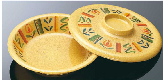
M112SJB 20cm ケープ皿 バジリコ 組高65 TAB 身 B 200×41 (640ml) ¥1,350 MF 蓋 C 210×31 ¥1,380 MF