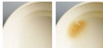
レンジアップメラミン 異常は発生せず