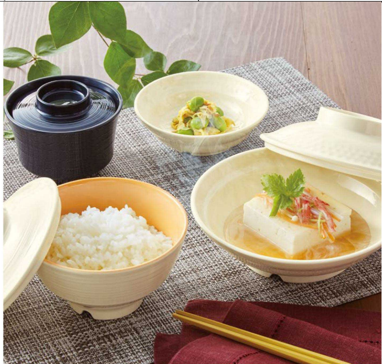
●使用製品：飯碗小(A105IOC)・煮物碗(B25I)・11.5cm丸深皿(D242BRI)・マルチボール(GC13B)・22.5cm六角箸(H92KA)