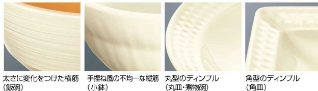
太さに変化をつけた横筋 (飯碗)

単色の食器だからこそ、無表情にならないよう配慮。それぞれの器ごとに、見栄え、盛り栄えを考え、丹念な意匠を施しました。メラミンならではの適度な重量感も活かし、食器としての面持ちを大切にしています。