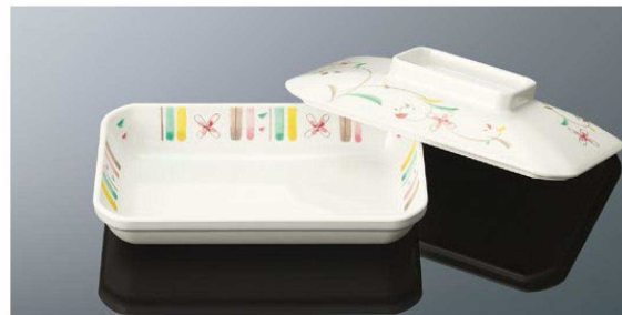
D98HSS 隅切深角皿 大 組高64 TA 身B 182×113×34 (430ml) ¥1,320 蓋C 185×115×34 ¥1,320 PP118 ¥470 (P257) 組高70