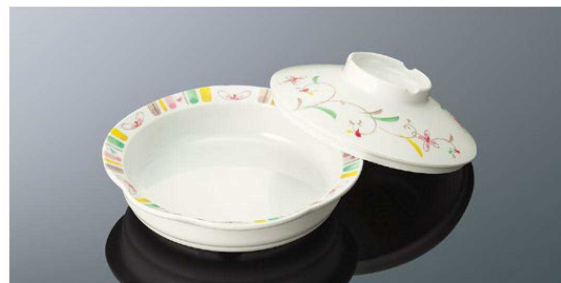
S73HSS 丸深皿 小 組高70 TAB 身B 166×40 (470ml) ¥1,360 蓋C 145×42 ¥1,020 PP016 ¥440 (P255) 組高75