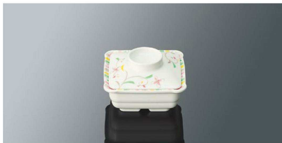
S78HSS 角小鉢 組高63 TAB 身B 102×102×43 (220ml) ¥1,070 蓋C 91×91×28 ¥760 PP110 ¥330 (P256) 組高70