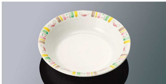
E97HSS ケープ皿 TAB 194×41 (620ml) ¥1,270 PP019 ¥470 (P255) 組高78