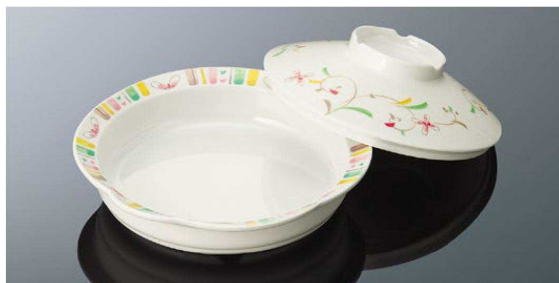
S72HSS 丸深皿 大 組高74 TAB 身B 185×41 (620ml) ¥1,580 蓋C 162×45 ¥1,180 PP018 ¥460 (P255) 組高77