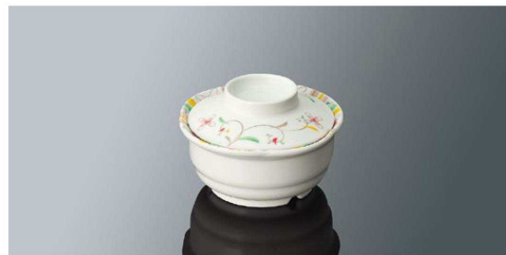
S76HSS 丸小鉢 小 組高73 TAB 身B 114×52 (280ml) ¥1,070 蓋C 98×30 ¥660 PP011 ¥270 (P254) 組高66