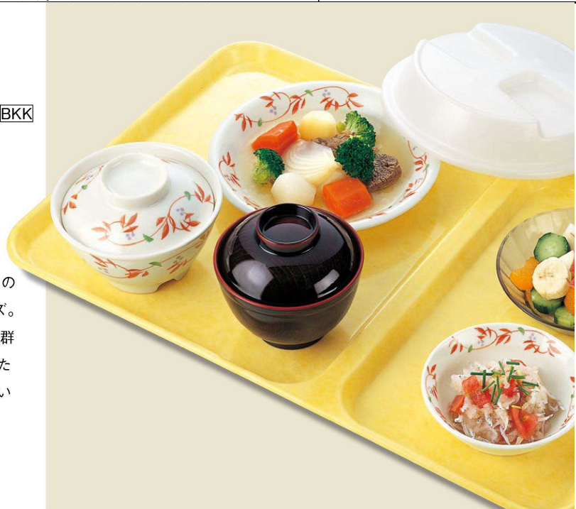
●使用製品 / 飯碗小 (A45BKK)・銚子小吸物椀 (B17TMR)・18cm丸皿 (D48BKK)・18cm用丸カバー (PP018IW)・深小皿 (E71BKK) ※仕切トレーは取り扱っておりません。