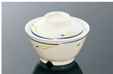
A44so 飯碗 中 組高95 ■ AB ■ 白飯：210g 身 B 134×70 (520ml) ¥1,100 全粥：310g 蓋 C 120×34 ¥680