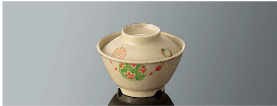
A46AR 飯碗 特小 組高80 ■ AB ■ 白飯：120g 身 B 113×60 (290ml) ¥860 全粥：170g 蓋 C 100×30 ¥640