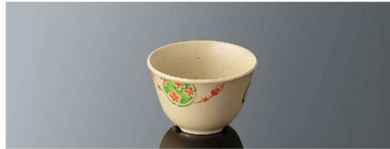
C23AR 湯呑 大 96×61 (230ml) ¥660