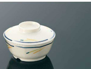
G50so 十角浅小鉢 組高72 ■ AB ■ 白飯：120g 身 B 112×109×46 (260ml) ¥930 全粥：170g 蓋 C 114×30 ¥730 ☎PP011 ¥270 (P254) 組高60