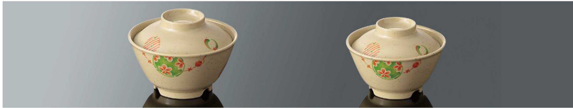
A44AR 飯碗 中 組高95 ■ AB ■ 白飯：210g 身 B 134×70 (520ml) ¥1,100 全粥：310g 蓋 C 120×34 ¥680