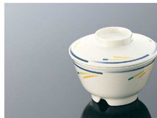
G48so 深小鉢 組高90 ■ AB ■ 白飯：120g 身 B 112×64 (320ml) ¥930 全粥：170g 蓋 C 114×30 ¥730 ☎PP011 ¥270 (P254) 組高78