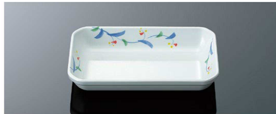
D98MZH 隅切深角皿 大 T A 182×113×34 (430ml) ¥1,320 ●PP118 ¥470 (P257) 組高70