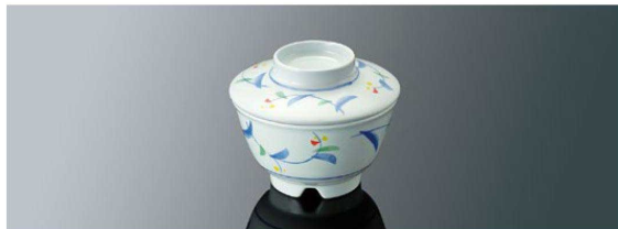
G58MZH 深小鉢 小 組高81 T AB 身 B 98×58 (220ml) ¥830 蓋 C 100×28 ¥650 ※ ※蓋は G59 と兼用 ●PP010 ¥260 (P254) 組高71