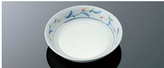
D50MZH 16.5cm 丸深皿 T AB 166×35 (430ml) ¥1,000 ●PP016 ¥440 (P255) 組高71 ※IWのみ