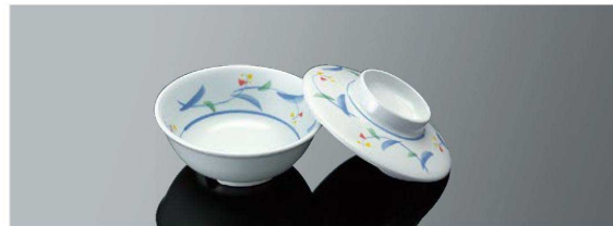
G59MZH 丸小鉢 小 組高62 T AB 身 B 99×39 (150ml) ¥660 蓋 C 100×28 ¥650 ※ ※蓋は G58 と兼用 ●PP010 ¥260 (P254) 組高53