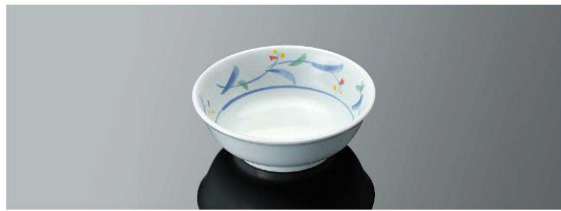
G45MZH 丸小鉢 浅型 T AB 114×40(210ml) ¥800 ●PP011 ¥270 (P254) 組高54