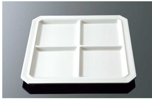
E204IWC パレット4 ホワイトC 11AB 270×270×19 ¥2,130