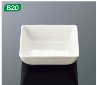
E149IWC 14cm角鉢 ホワイトC 11AB 140×140×46 (530ml) ¥1,030 ●PP114 ¥480 (P256) 組高82