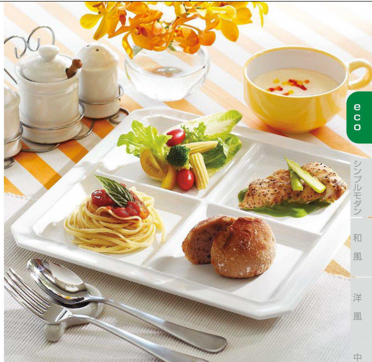
●使用製品 / パレット4 (E204IWC)・柄付スープカップ (C18PY)・デザートスプーン ST (H343SLV)・デザートフォーク ST (H342SLV)