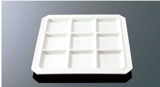
E209IWC パレット9 ホワイトC T A 270×270×19 ¥2,450