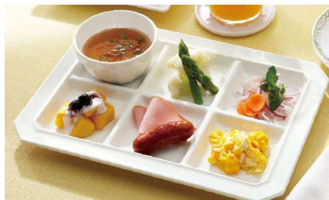
●使用製品 / パレット6 (E206IWC)・スフレ(G77IWC)