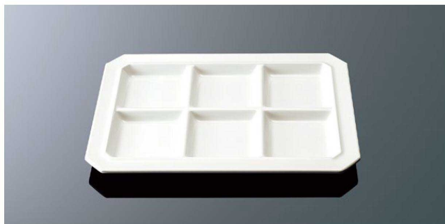
E206IWC パレット6 ホワイトC T A 270×193×19 ¥1,540