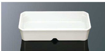
G102IWC ボックス2 ホワイトC T AB 154×76×33(200ml) ¥800