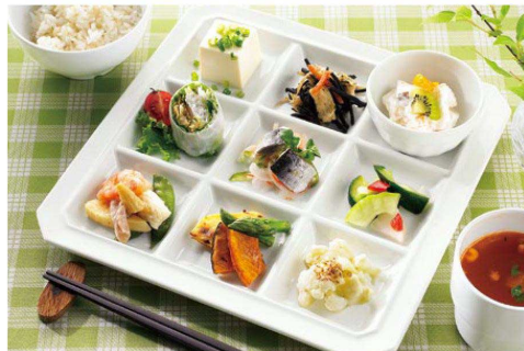
●使用製品 / パレット9 (E209IWC)・スフレ(G77IWC)・11cmボール(E134IWD)・マグカップ(M575PW)・22.5cmPBT箸(H72MBN)