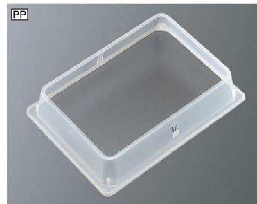
PP206CL パレット6用皿枠 クリア 277×200×58 ¥520 ※(26.4~27.1)cm×(18.6~19.3)cmの食器に対応