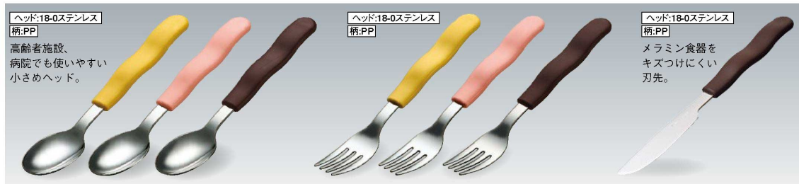
H373 デザートスプーン 181mm / ヘッド: 幅35×長さ50 (35g) ¥690 色: イエロー(Y)・ピンク(PK)・ブラウン(BN)