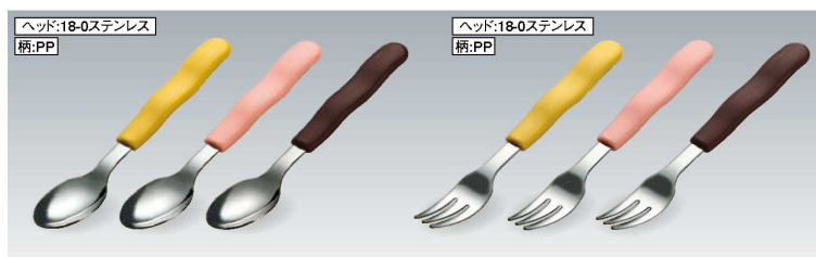
H377 ティースプーン 140mm / ヘッド: 幅27×長さ39 (20g) ¥570 色: イエロー(Y)・ピンク(PK)・ブラウン(BN)