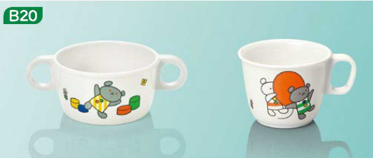
540ko 両手付カップ 143×95×51(230ml) ¥1,150 C16ko 柄付カップ 105×82×62(190ml) ¥910

小さなお子さまでも、使いやすい耳付きデザイン食器をしっかり持ちやすい耳を設けた形状。食器内側の立ち上がりも、お子さまが料理をすくいやすい角度を持たせ、様々なメニューに対応します。