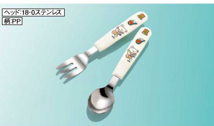
H386ko フォーク 139mm/ヘッド:幅24×長さ38(22g) ¥510