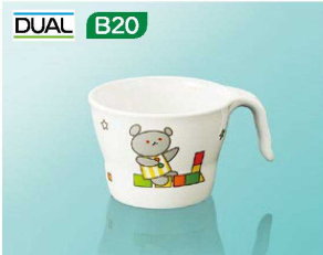
C12ko ユニマグカップ 小 1AB 109×84×59(190ml) ¥1,250 ※P301のC6Cが蓋として使えます。