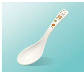
L6ko ユニレンゲ 小 1A 142mm/ヘッド:幅38×長さ60(19g) ¥270 ※製品の特長をP309で紹介しています。