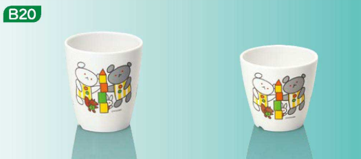
C4ko コップ大 73×80(200ml) ¥660 C3ko コップ小 74×69(175ml) ¥590