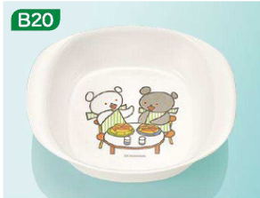
J4ko 耳付ボール 150×125×42(340ml) ¥970