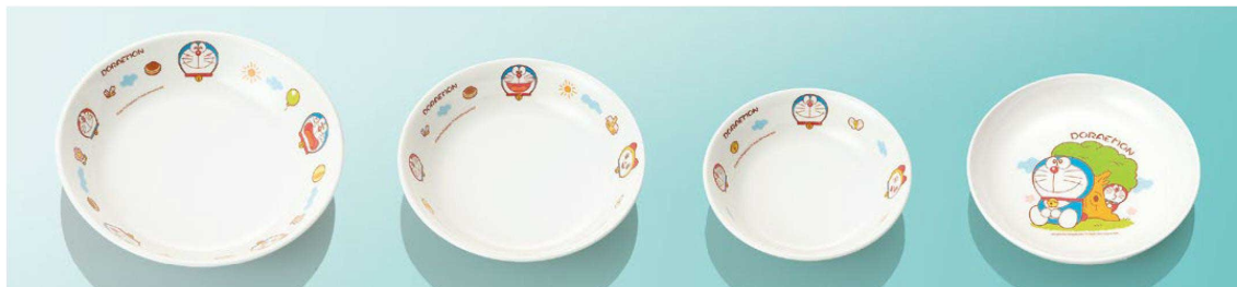
D17Do 深菜皿 167×35(470ml) ¥1,000 ●PP016 ¥440 (P255) 組高71 ※IWのみ D52Do 14cm丸深皿 T AB 142×33(285ml) ¥920 ●PP014 ¥420 (P255) 組高68 D62Do 12cm丸深皿 T AB 120×32(190ml) ¥700 ●PP012 ¥280 (P254) 組高47 D10Do 菜皿 小 136×24 ¥670 ●PP014 ¥420 (P255) 組高60