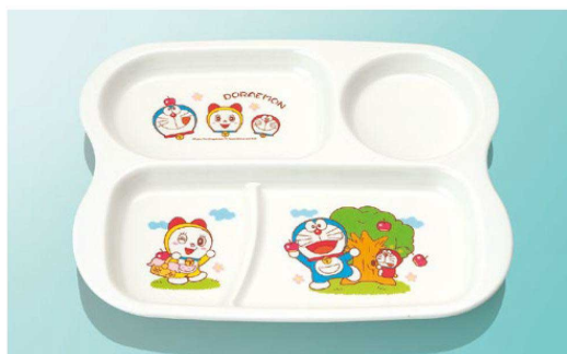
E16Do ランチプレート T AB 255×209×22 ¥2,150

すくいやすい形状。 離乳食にも使えます (J25・J31) 小さなお子さまでも、 食材がすくいやすい よう、器の周囲は角度 をつけた立ち上がり 形状にしました。