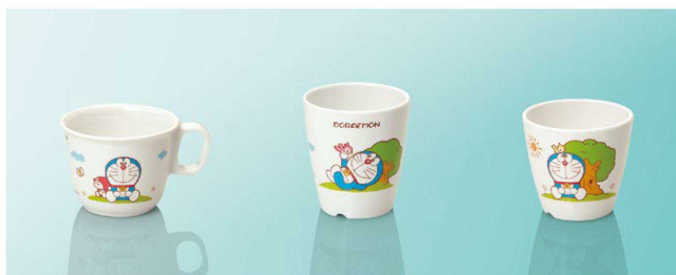
C16Do 柄付カップ 105×82×62(190ml) ¥910 C4Do コップ大 73×80(200ml) ¥660 C3Do コップ小 74×69(175ml) ¥590