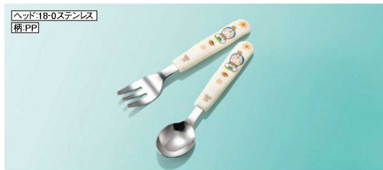
H386Do フォーク 139mm/ヘッド:幅24×長さ38(22g) ¥510 H387Do スプーン 138mm/ヘッド:幅31×長さ38(23g) ¥510