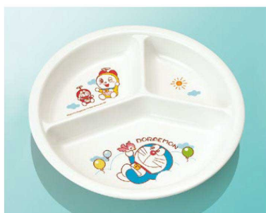
J25Do 三つ仕切皿 小 194×28 ¥1,350 ●PP019 ¥470 (P255) 組高65