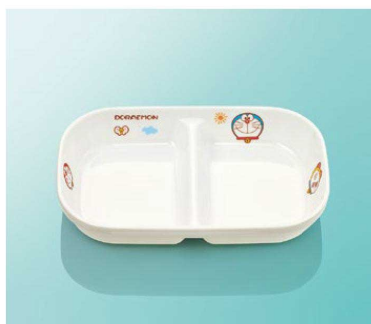
J31Do 角二つ仕切皿 小 T AB 170×107×32 ¥1,300