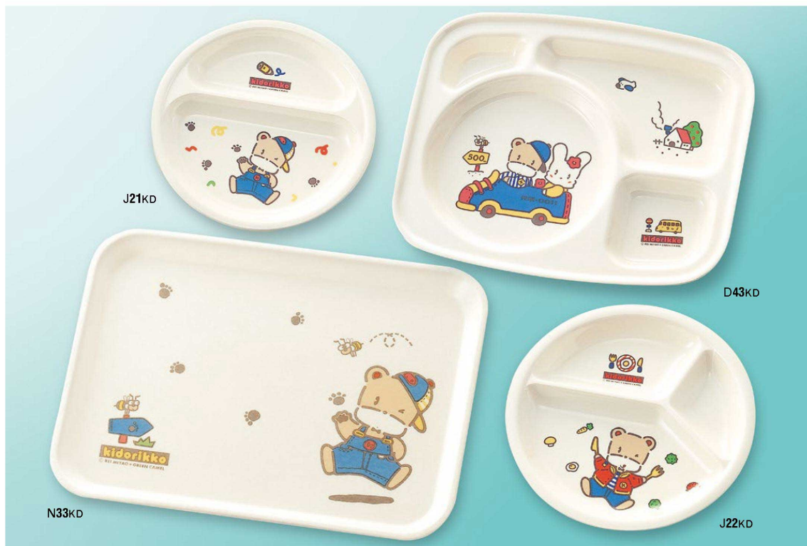
J21KD ニつ仕切皿 200×25 ¥1,100