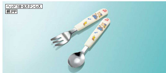
H386KD フォーク 139mm/ヘッド幅24×長さ38 (22g) ¥470