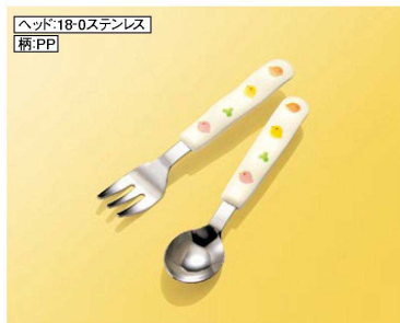
H386TH フォーク ヘッド:18・0ステンレス 柄:PP 139mm/ヘッド:幅24×長さ38 (22g) ¥470