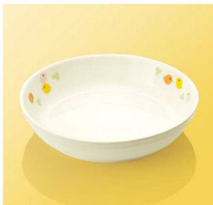
JT90TH 16cm スタック深皿 ■AB ■ 164×36(460ml) ¥1,660 ●PP016 ¥440 (P255) 組高72