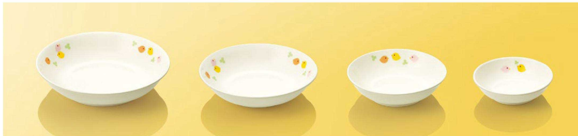
JT78TH 17cm 深皿 ■AB 170×37(470ml) ¥1,600