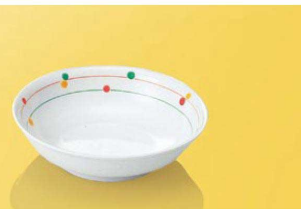
JT25CR 12.5cm深皿 TAB 124×33(200ml) ¥1,180