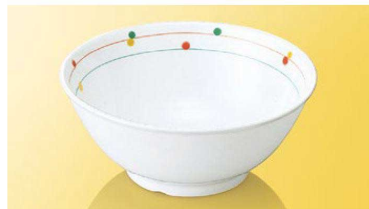
JT15CR 16cmボール TAB ※ 161×67(750ml) ¥2,100 ●PP117 ¥440 (P254) 組高81