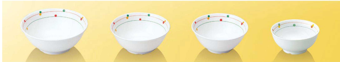
JT11CR 14cmボール TAB ※ 141×55(440ml) ¥1,660 ●PP014 ¥420 (P255) 組高91