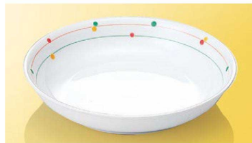
JT30CR 20cmカレー皿 TAB ※ 199×39(710ml) ¥2,270