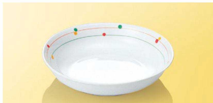
JT18CR 17cm深皿 TAB 170×37(460ml) ¥1,600