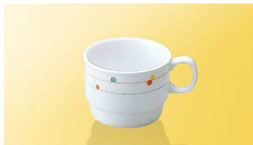
JT5CR 手付カップ TAB 106×81×64(210ml) ¥1,470