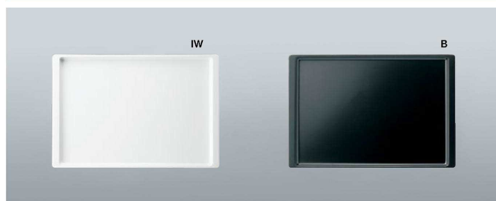
M674 長角盆 中 295×201×16 ¥1,730 色:ホワイト(IW)・ブラック(B)

シンプルモダン 和風 洋風 中華 病院・高齢者 UD・PPカバー 弁当箱 強化磁器 大型食器・取り皿 テーブルグッズ キッズ&スクール トレー