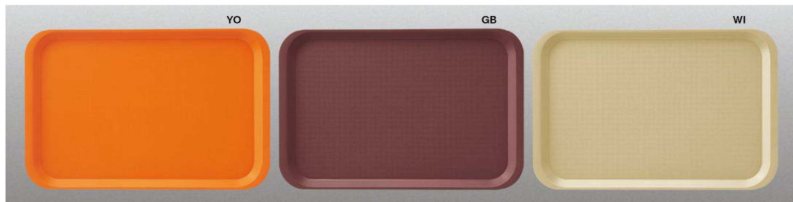
NP10 44cm長角トレー 435×285×21 ¥1,520 色:イエローオレンジ(YO)・ブラウン(GB)・高麗(WI)