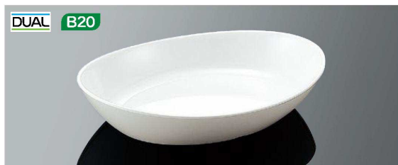
E127IWD オーバルディッシュ 小 ホワイトDC TAB 221×150×43(560ml) ¥1,900