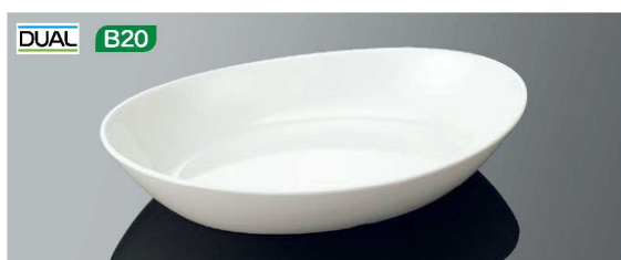
E126IWD オーバルディッシュ ホワイトDC TAB 245×172×47(780ml) ¥2,030