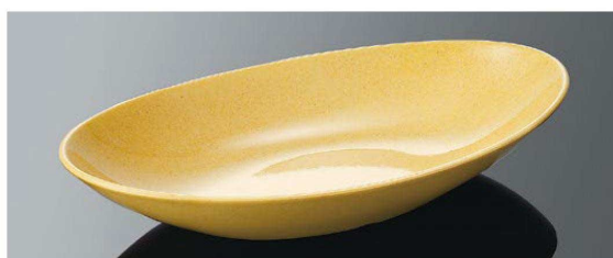
E121SDY オーバルパスタプレート サンドイエローC TAB 296×167×52(920ml) ¥1,900