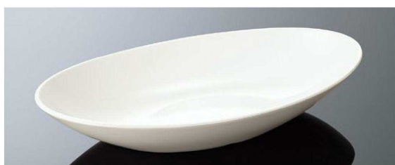
E121IWC オーバルパスタプレート ホワイトC TAB 296×167×52(920ml) ¥1,900