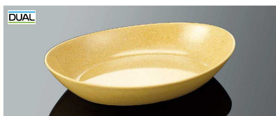
E126SYD オーバルディッシュ サンドイエローDC TAB 245×172×47(780ml) ¥2,030