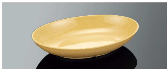
E220SDY 22cm オーバルディッシュ サンドイエローC TAB 220×150×43(560ml) ¥1,350 ●PP122 ¥540(P255) 組高81