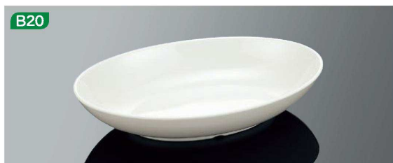
E220IWC 22cm オーバルディッシュ ホワイトC TAB 220×150×43(560ml) ¥1,350 ●PP122 ¥540(P255) 組高81