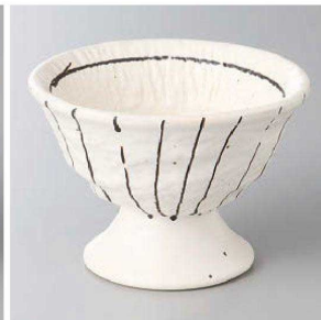
127-11-35J 1,400円 ストライプ(白)高台小鉢 10.2×7.4cm