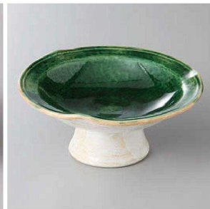
127-4-33J 1,600円 織部タキ高台皿 12.5×5.5cm