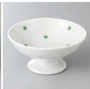
127-14-23J 1,600円 志野グリーンドット高台デザート 11.7×5.8cm