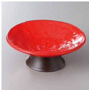
127-1-77J 1,430円 赤塗り高台4寸皿 13.8×5cm