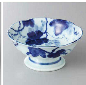
127-20-34J 880円 藍染ぶどうデザート鉢 12×5.5cm