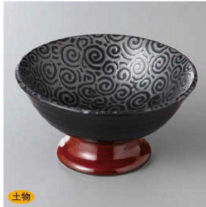
127-5-1J 1,600円 朱巻天目唐草高台小鉢 12.2×6.3cm