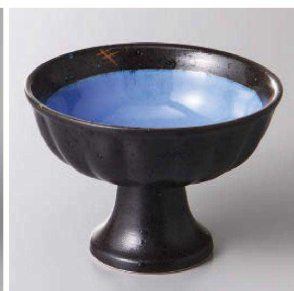
127-18-58J 970円 海流菊高台小鉢 10×7.5cm