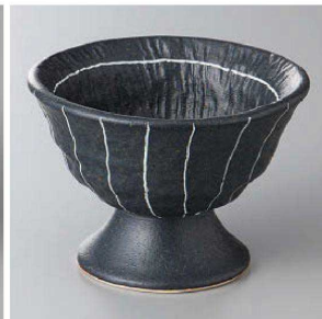
127-10-35J 1,400円 ストライプ(黒)高台小鉢 10.2×7.4cm