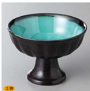
127-17-23J 1,200円 ヒスイ天目高台小鉢 10.2×7cm