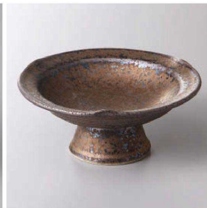
127-3-58J 1,650円 金結晶三ツ押高台小鉢 12.5×5.5cm