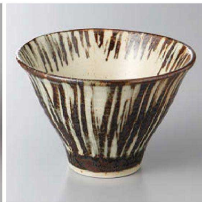
127-2-56J 1,650円 刷毛目十草反深鉢 12.5×8cm