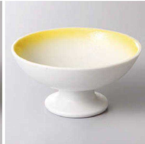
127-8-58J 1,450円 イエロー吹高台小鉢 11.8×6cm