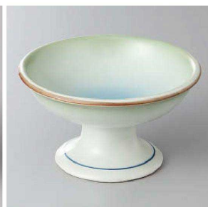
127-19-71J 1,150円 若草高台小鉢(大) 11.5×6cm