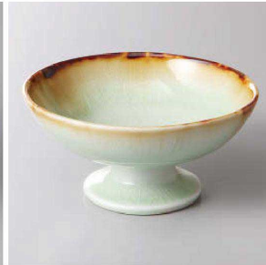
127-7-58J 1,450円 ヒツ貫入高台小鉢 11.8×6cm