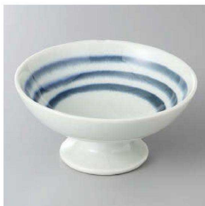
127-13-23J 1,600円 御深中三本線高台デザート 11.7×5.8cm