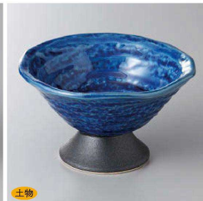
127-12-33J 1,300円 紺釉 高台デザート 12×7.5cm