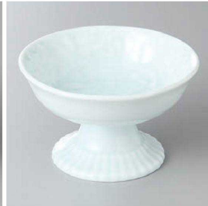
127-6-32J 1,500円 青地ユリ型デザート 11.5×6.7cm