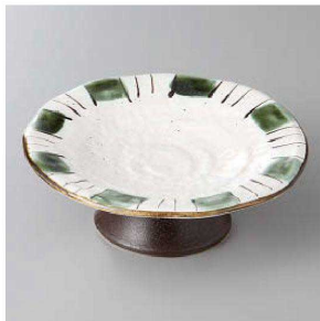
127-9-34J 1,800円 織部十草高台4.0寸皿 14×4.7cm