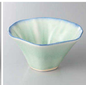
127-16-78J 1,210円 御深井朝顔型小鉢 12×11.7×6.4cm