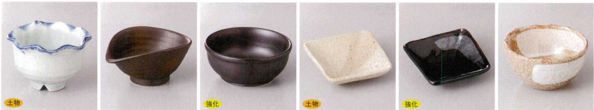
159-31-77J 950円 ブルー貫入輪花小鉢 8.8×6cm 159-32-35J 900円 黒伊賀ねじり鉢(小) 10.8×8.1×5.1cm 159-33-48J 900円 W/B黒マットボール千代口(強化) 9.2×3.8cm 159-34-23J 1,000円 リプル角小皿 10.2×10×3.2cm 159-35-23J 1,000円 銀彩スクエア小 10.1×9.7×3cm 159-36-33J 860円 茶粉引剛毛モエギ3.0鉢 9.5×5cm