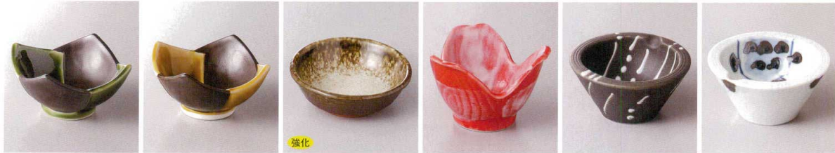
159-13-71J 1,000円 織部市松角小付 8.2×8.2×4.7cm 159-14-71J 1,000円 黄瀬戸市松角小付 8.2×8.2×4.7cm 159-15-73J 980円 織部かすみ反3.0丼 8.8×3cm 159-16-60J 900円 赤彩花三ツ山珍味 9×9×6.5cm 159-17-58J 1,000円 銀河片口小付 9.2×4.9cm 159-18-58J 1,000円 染付片口小付 9.2×4.9cm