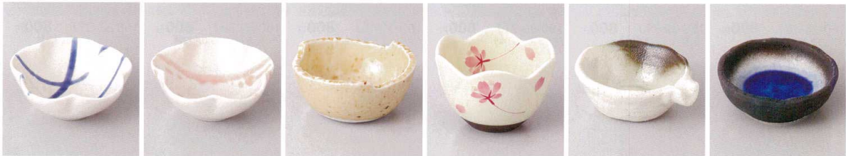
159-25-27J 950円 淡柚子ナス紺流し9cm小付 9.2×9×3.2cm 159-26-27J 950円 淡柚子上掛ピンク流し9cm小付 9.2×9×3.2cm 159-27-27J 950円 オレンジ灰三ツ切小付 8.9×4cm 159-28-93J 900円 有田焼 桜の舞小付 10入 8.5×5.6cm 159-29-56J 900円 炭化黒吹き片口短小付 8.3×7×3cm 159-30-77J 940円 青海丸千代口 8×2.8cm