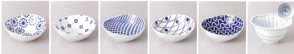
159-1-93J 1,200円 有田焼 ハナツメ楕円小付(B) 5入 11×10×3.5cm 159-2-93J 1,200円 有田焼 マルコウシ楕円小付(B) 5入 11×10×3.5cm 159-3-93J 1,200円 有田焼 ドット楕円小付(B) 5入 11×10×3.5cm 159-4-93J 1,200円 有田焼 タテワク楕円小付(B) 5入 11×10×3.5cm 159-5-93J 1,200円 有田焼 アーチ楕円小付(B) 5入 11×10×3.5cm 159-6-93J 1,100円 有田焼 十草蘭六方花小付 5入 9×4.5cm